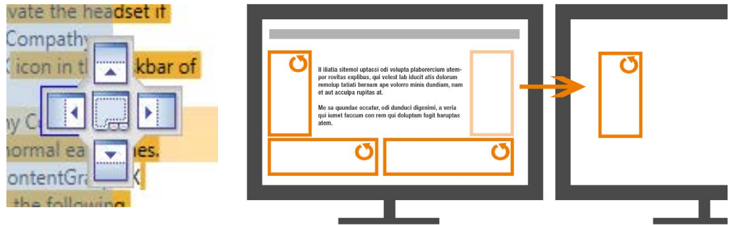
» Congree-Fenster andocken und verschieben

Falls Sie ein Congree-Fenster temporär nicht benötigen, können Sie es schnell ausblenden. Die Congree-Integration in JustSystems XMetaL® XMAX unterstützt außerdem das flexible Ablösen, Verschieben und Andocken von Congree-Fenstern im Editor. So können Sie Ihre Fenster nach Belieben anordnen, staffeln oder sogar auf einen weiteren Bildschirm verschieben, um z. B. den Editierbereich zu maximieren: